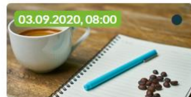
08:00 · Lendhafen, Graz Nachhaltigkeits-FrühSTÜCK