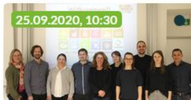
10:30 · Steirerhof Graz, Graz Präsentation der SDG-Pio...